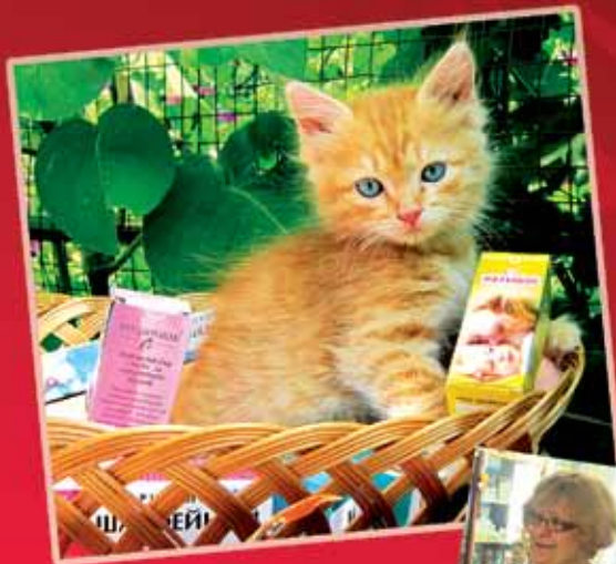
г.Тараз (Казахстан)