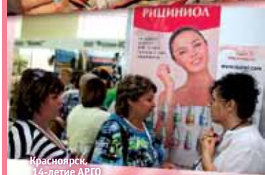
Красноярск, 14-летие АРГО