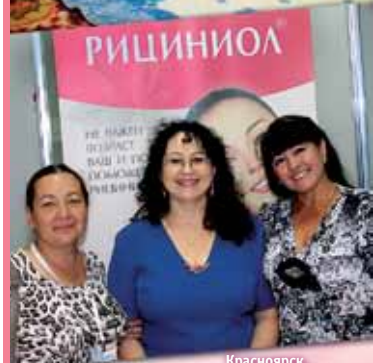
Красноярск, 14-летие АРГО