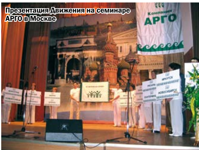
Презентация Движения на семинаре АРГО в Москве