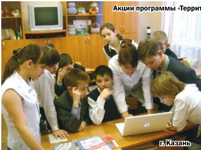
Акции программы «Территория здорового образа жизни»