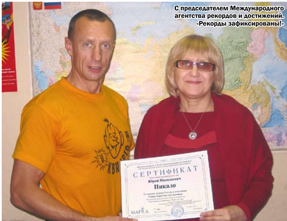
С председателем Международного агентства рекордов и достижений. «Рекорды зафиксированы!»