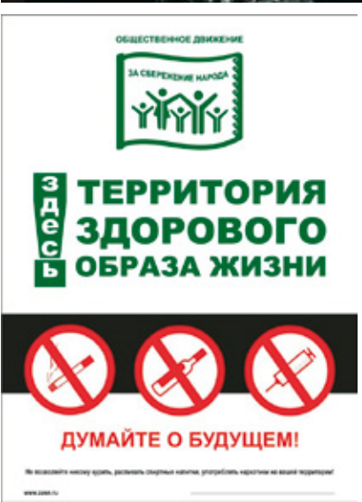
ОАО «Международный аэропорт Волгоград» – территория здорового образа жизни