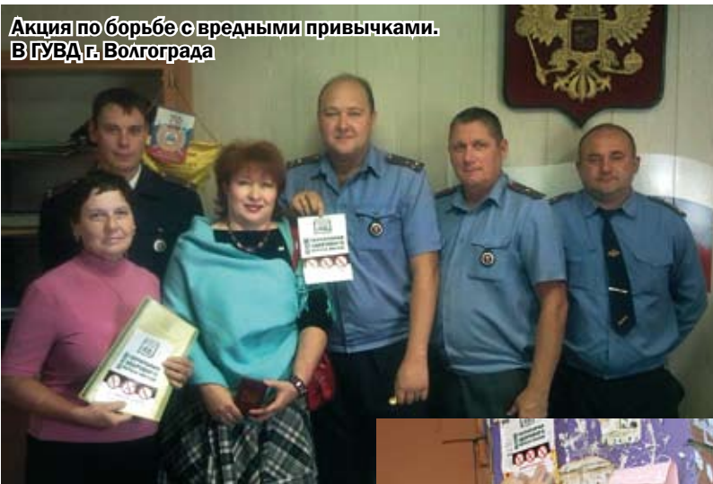
Акция по борьбе с вредными привычками. ВГТУВД г. Волгограда

25 сентября с акции против курения, наркотиков и злоупотребления алкоголем Общественное движение «За сбережение народа» начало осуществлять Общероссийскую программу под названием «Здесь – территория здорового образа жизни!» Руководство Движения призвало участников Движения и остальных граждан начать борьбу с вредными привычками как на локаль-