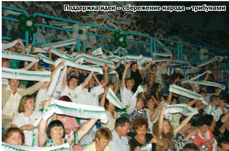
Поддержка идеи – сбережение народа – трибунами

до 54. Но самое главное, что инициативы по пропаганде здорового образа жизни руководства Движения, примеры проведения благотворительных акций, просветительских и спортивно-оздоровительных мероприятий не только находят понимание и горячую поддержку на местах, но и получают развитие. Ежегодный XVIII Международный юношеский турнир «Приз Карелина», собравший тысячи поклонников спорта и, в частности, греко-римской борьбы, в октябре этого года прошел при участии Движения «За сбережение народа».