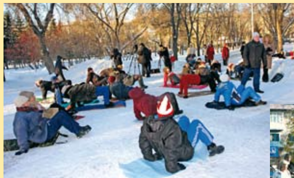
Занятия с группой