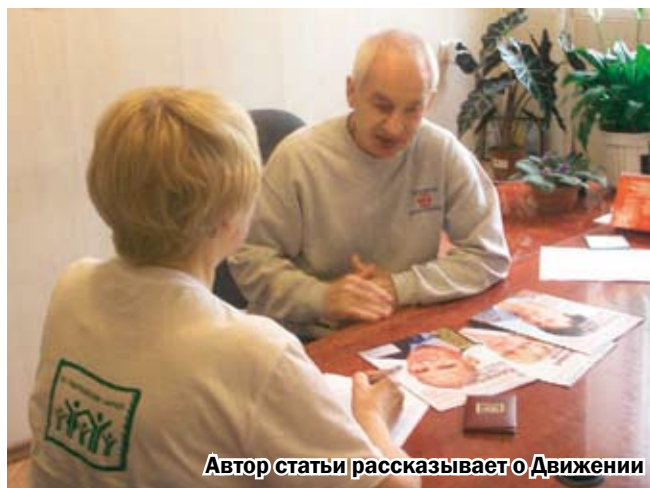
Автор статьи рассказывает о Движении

Л.Ф. – В Вашем арсенале – уже 4 книги, много просветительских статей: о здоровье,